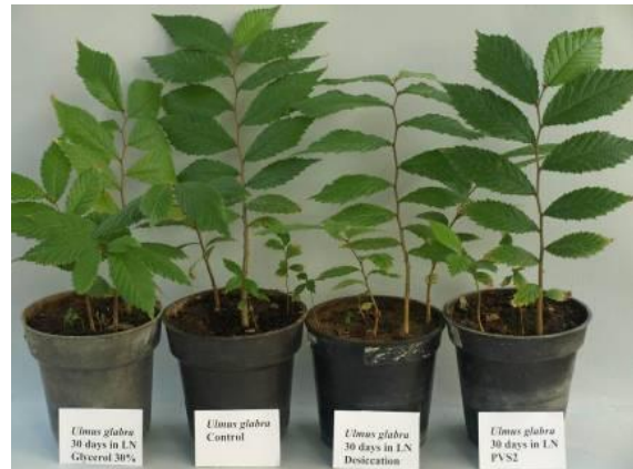
شکل ۳. نهال های حاصل از بذر با پیش تیمارهای مختلف در کنار گیاهان حاصل از بذر شاهد

مختلف جمع آوری و نسبت به نگهداری بلندمدت ژرم پلاسما آن اقدام کرد. کاهش جوانه زنی به نسبت سریع بذور این گونه در شرایط عادی، استفاده از فناوری فراسرد برای نگهداری بلندمدت بذر این گونه را الزام آور کرده است [۱۷-۱۸-۱۹].