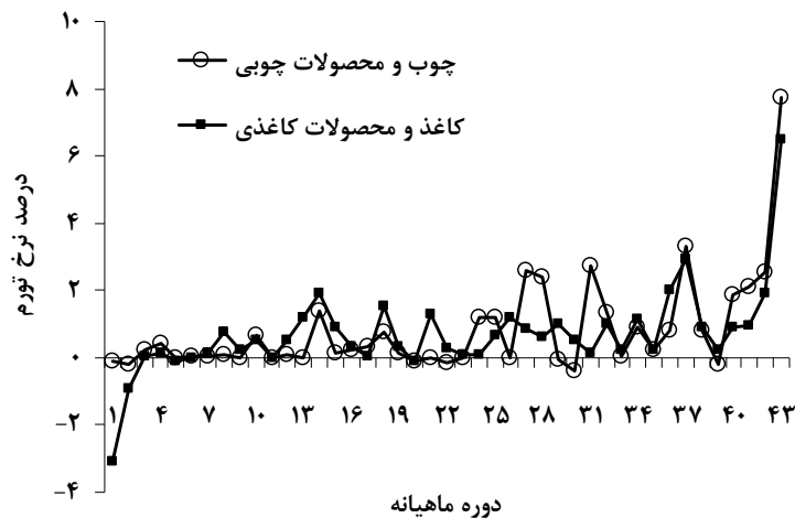
شکل ۱. روند نرخ تورم ماهیانه چوب و محصولات چوبی و کاغذ و محصولات کاغذی (توضیحات: دوره ۲۰ شروع هدف‌مندی یارانه‌ها، دوره ۲۳ شروع افزایش قیمت نرخ ارز، دوره ۳۰ شروع تحریم‌ها، و دوره ۳۹ شروع تحریم‌های اروپا و گسترش تحریم‌های امریکا)

شکل ۱ و ۲ روند نرخ تورم ماهیانه و سالیانه دوره مطالعه (فروردین ماه ۱۳۸۸ تا آبان ماه ۱۳۹۱) را، که دربرگیرنده دوره قبل و بعد از هدف‌مندی است، نشان می‌دهد. نرخ تورم و درصد تغییرات قیمت چوب و محصولات چوبی و کاغذ و محصولات کاغذی در قبل و بعد از هدف‌مندی یارانه‌ها و همچنین اثر تحریم‌ها و نرخ ارز بر نرخ تورم این دو نوع محصول در جدول ۶ مشخص شده است. همان‌طور که مشخص است، نرخ تورم و درصد تغییرات قیمت چوب و محصولات چوبی و کاغذ و محصولات کاغذی در بعد از هدف‌مندی یارانه‌ها افزایش یافته است. آثار منفی هدف‌مندی