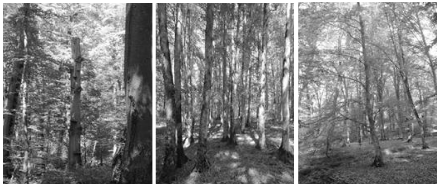
شکل ۱. مرحله‌های تحولی جنگل راش نکا، از راست به چپ به ترتیب مرحله‌های اولیه، اوج و پوسیدگی

در اجرای این تحقیق، ابتدا بخش‌هایی از قطعه 36 شاهد مشخص شد که براساس نقشه‌های کتابچه طرح جنگلداری دارای شرایط اداپیکایی یکسان از لحاظ طبقات شیب، طبقات ارتفاع، سنگ مادر و خصوصیات خاک‌شناسی است [۸]. در مرحله بعد، با جنگل‌گردشی، شرایط حاکم بر توده‌های جنگلی در سطح قطعه شاهد بررسی شد. سپس سه مرحله تحولی اولیه، اوج و پوسیدگی که به‌نوعی معرف سطح چشمگیری از