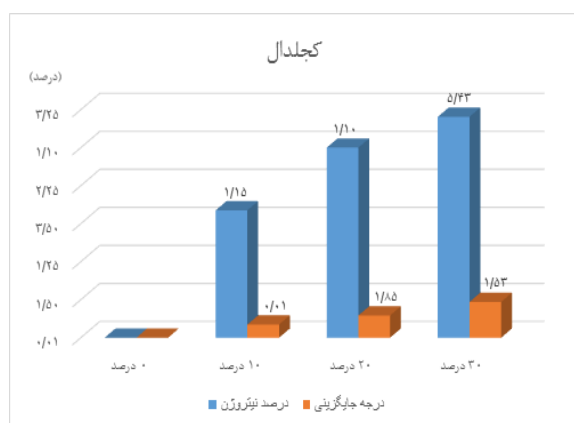
شکل ۱. نتایج تست کج‌دال کاتیونی کردن نانوالیاف سلولز