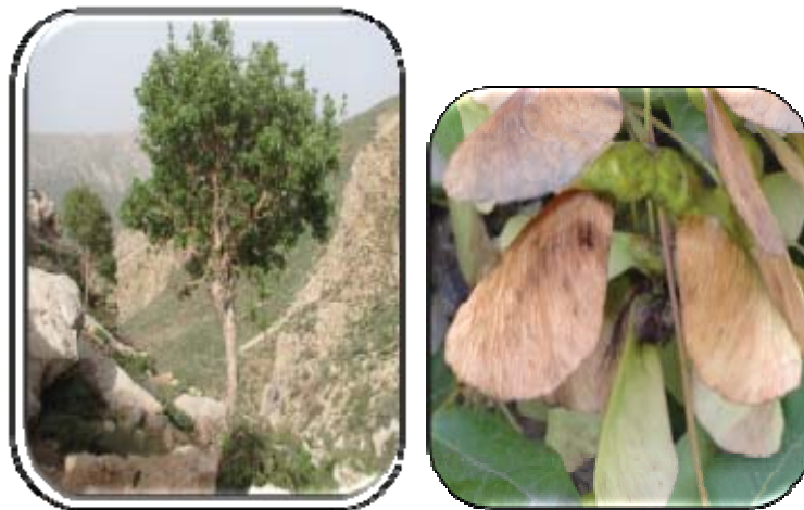
شکل ۱. درخت و بذر کیکم ترکمن یا سیاه کرکو

سیاه کرکو یا کیکم ترکمن ۱ ، یکی از گونه های جنس افرا، از خانواده افرا ۲ و راسته Sapindales، بومی مناطق جنوبی اروپا بوده و در ایران دارای ۵ زیرگونه است که به طور عمده در دامنه های البرز و زاگرس انتشار دارند. زیرگونه های آن در ایران شامل کیکم کردستانی ۳ ، کیکم قفقازی ۴ ، سیاه کرکو یا کیکم ترکمن ۵ ، کیکم شیرازی ۶ ، و کیکم ایرانی ۷ است. پراکنش زیرگونه سیاه کرکو یا کیکم ترکمن فقط در ترکمنستان و ایران است [۱۳] و در نواحی شمال شرق کشور و از گِردگان تا شمال خراسان امتداد دارد [۱۴]. درختی غالباً کوتاه یا درختچه ای، دارای فندقه های قهوه ای بالدار، تقریباً متقارن و به شکل تخم مرغی با برگ های سه لوبی به طول